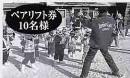
ペアリフト券 10名様 八千穂高原スキー場

※プレゼントは毎月1日に変わります。景品例とイメージ写真です。 変更する場合がございます。内容は応募画面でご確認下さい。