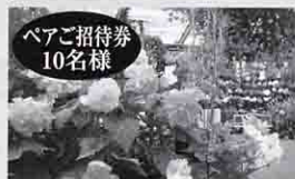
ペアご招待券 10名様 天城高原ベゴニアガーデン

【お問い合わせ】NPO法人 L.W.サポート事務局/NPO法人地域活性化支援センター TEL.054-252-3481