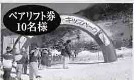
ペアリフト券 10名様 シャトレーズスキーリゾートハケ岳