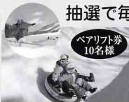
ペアリフト券 10名様 しらかば2in1/白樺高原国際スキー場