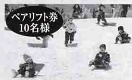
ペアリフト券 10名様 ふじてんスノーリゾート