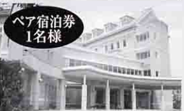
ペア宿泊券 1名様 作東バレンタインホテル