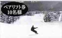
ペアリフト券 10名様 おんたけ2240