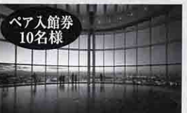
ペア入館券 10名様 六本木ヒルズ東京シティビュー