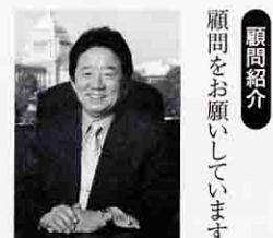
顧問紹介 顧問をお願いしています。

「これがMBOだ!」(共著)かんき出版2007年、「雇用改革」雇用の質を改善せよ(共著)東洋経済新報社 2007年、「少子化克服への最終処方箋」(共著)ダイヤモンド社 2007年、「成功する!」地方発ビジネスの進め方(かんき出版)2006年、「雇用を創る構造改革」日本経済新聞社 2004年等。