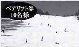
ペアリフト券 10名様 富士見パノラマリゾート