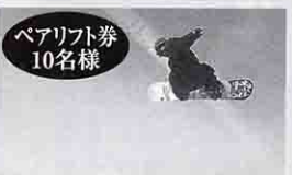
ペアリフト券 10名様 白樺湖ロイヤルヒル