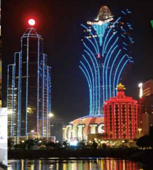
日本と時差が1時間。直行便で4~5時間ととても便利で魅力溢れる観光地です。香港&マカオというプランの時代からマカオ単独に、日本から約40万人が訪れ、人気の「マカオで3泊・4泊」という旅行スタイルに変化しています。

「贅沢な」という言葉は人それぞれイメージが違うと思いますが、今のマカオはすべての人に「ゆとり」とした自在なひとときを「贅沢に」感じさせてくれます。「リッチ」「ラグジュアリー」という単純ではない「満足感」「夢」のような、それでいて刺激的な「魔法の国」。5年ほど前にマカオを旅行した時とは違う、充実度、進化する新しいイメージと多彩な「ステイネーション」「カジノ」「世界遺産の街」「5つ星ラックスホテル」「エンターテイメントなショー」。「東西の食文化が融合した味覚の世界遺産とも言える美食グルメ」「右肩上がりの経済と世界有数のブランドショップ街」「二人歩きできる安心で安全な街」。マカオも最高！すっかり陶酔してしまつた3泊4日をご紹介いたします。富士山静岡空港から定期便はまだですが、チャーター便が予定されているようです。是非、ご参考にしていただければと思います。