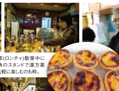
ポルトガル伝統の味をアレンジしたマカオのエッグタルトは欠かせない。