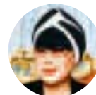
ファッションデザイナー 桂由美さん